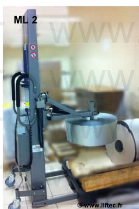
Éperon pour retournement électrique de bobine