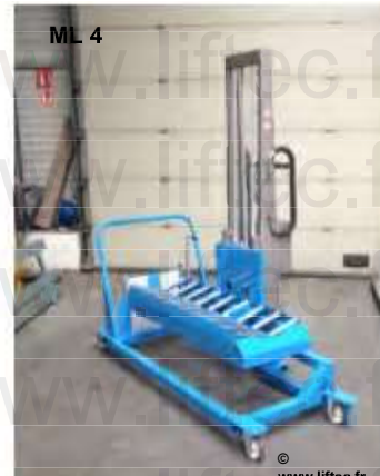
Chariot équipé d'un convoyeur