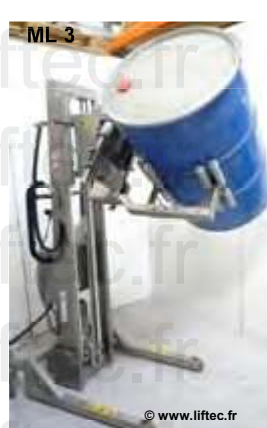
Pince pour retournement électrique de fût