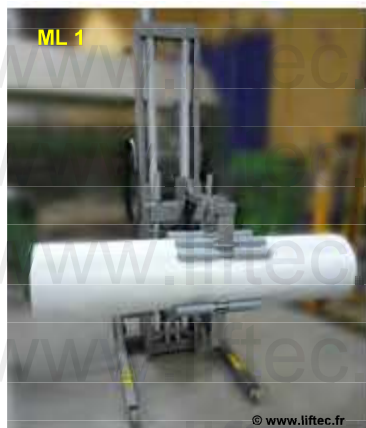
Pince pour retournement électrique de rouleau