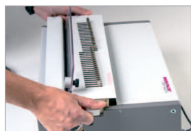
Outils de perforation interchangeables très rapidement