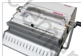
Connectable aux différents modules de reliure MBS

Perforeuse électrique universelle grâce à ses outils interchangeables et connectable aux systèmes modulaires de reliure RENZ «MBS».