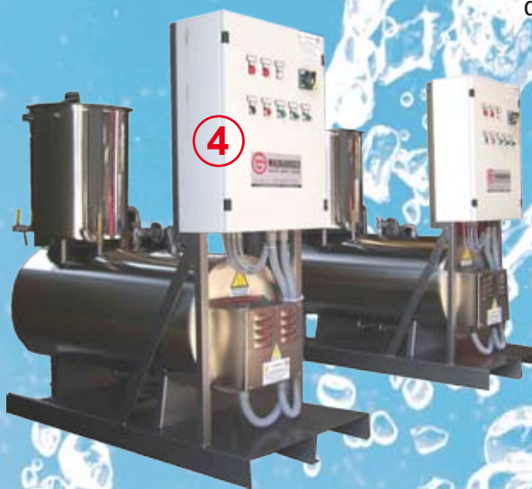
2 GVE-I 120 = 2x160 kg/H

G.V.E. G.V.E. Inox I produttori di vapore elettrici serie GVE vengono utilizzati in tutti i campi di applicazione dove è richiesto vapore tecnologico. La serie GVE-I invece produce vapore pulito o puro e viene utilizzato nell'industria alimentare, conserviera, farmaceutica, enologica, chimica, petrolchimica e in altre particolari applicazioni che richiedono questo tipo di vapore. Possono essere costruiti in acciaio inossidabile AISI 304, AISI 316, AISI 304L, AISI 316L o acciai speciali. Entrambi i modelli possono essere costruiti con pressioni da 0,5 a 20 bar. Di serie il rivestimento si presenta in acciaio verniciato; su richiesta è possibile fornirlo in acciaio lucido. Fino al modello GVE 150 il serbatoio dell'acqua e la pompa possono essere collocati sotto il generatore di vapore per ridurre al massimo l'ingombro. Tutti i produttori sono forniti in versione monoblocco e completi di tutte le apparecchiature di comando, di controllo e di sicurezza. A richiesta possono essere equipaggiate di ruote per il facile spostamento della macchina. Le serie GVE e GVE-I in Italia non necessitano di conduttore patentato, visita di messa in servizio e di visite periodiche.