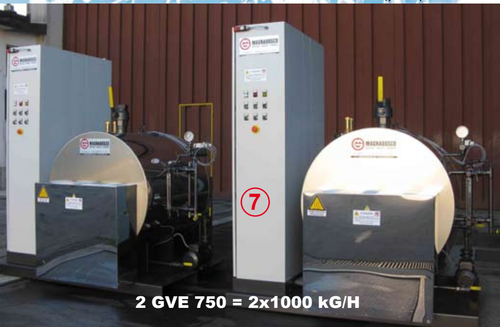
2 GVE 750 = 2x1000 kg/H

OPTIONAL: premontaggio su skid, PLC touch screen, serbatoio acqua di alimento e recupero condense, serbatoio blow down, spurgo automatico temporizzato, dispositivo per controllo salinità, addolcitore per trattamento dell'acqua, preriscaldatore acqua di alimento, surriscaldatore di vapore, condensate system (pompa di innesco alla pompa di alimentazione in caso di condense con temperatura superiore a 80°C), degasatore, seconda pompa, sonda fail-safe.