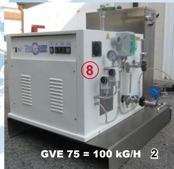
GVE 75 = 100 kg/H