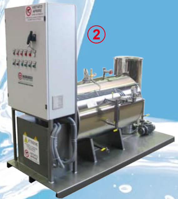
GVE 300 = 400 kg/H