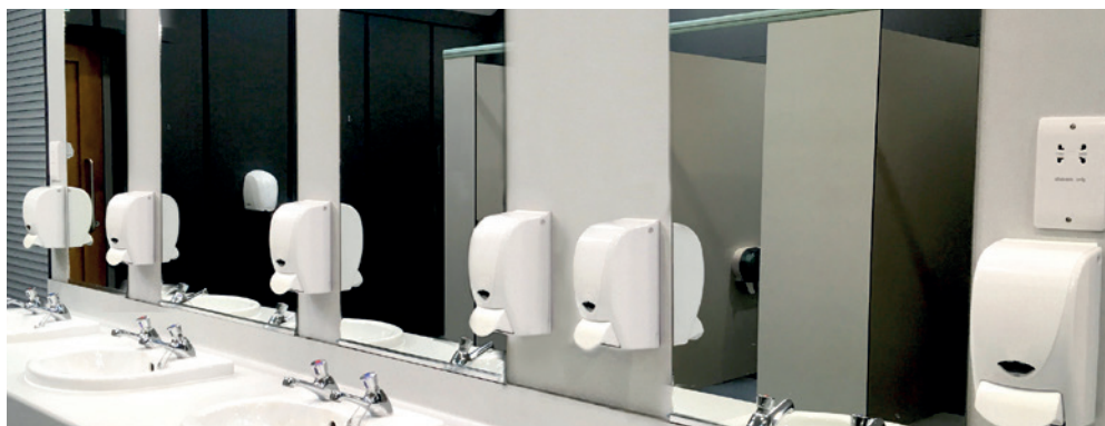
Réf. 6800 PLS >