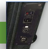
Possibilité de connectique externe