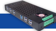
Tabiconnect® Charge & synchro intelligentes pour appareils Android et iOS