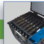
Intégration d'ordinateurs portables