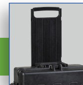
Système de trolley escamotable