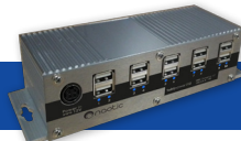
Tabipower® Charge intelligente pour appareils Android et iOS