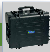
Corps de valise antichoc