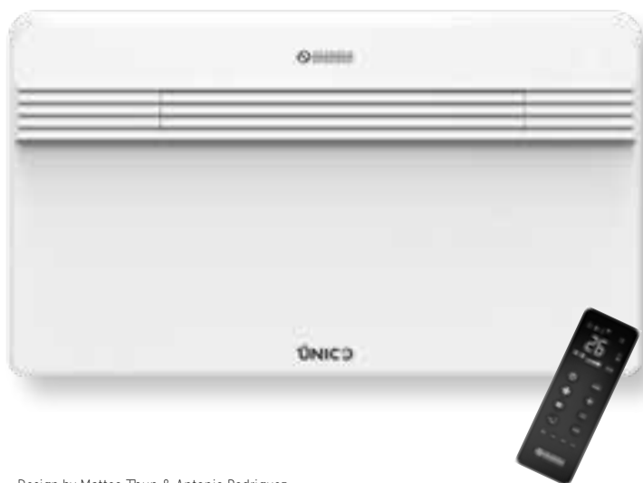
Design by Matteo Thun & Antonio Rodriguez