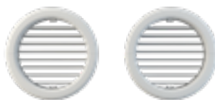
GRILLES Ø 20 CM

Deux modes de connexion et toute la sécurité du cloud by Olimpia Splendid