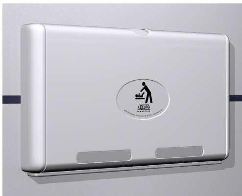
TABLE À LANGER MURALE : AX6901-G