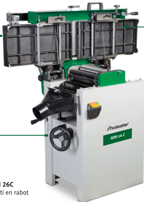
Fig. : ADH 26C · Converti en rabot