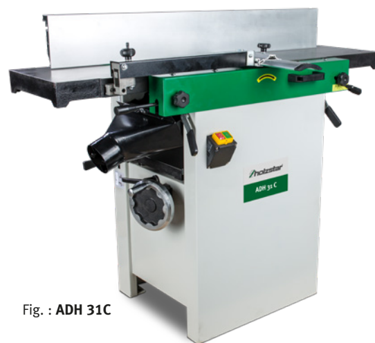
Fig. : ADH 31C