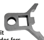
Fig. : Gabarit de réglage des fers