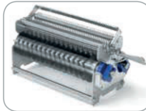
Gruppo lame taglio: da 10 mm con 48 lame da 15 mm con 32 lame Cutting blade assembly: 10 mm with 48 blades 15 mm with 32 blades