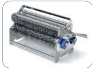
Gruppo lame inteneritrice con 96 lame Tenderizing blade assembly with 96 blades