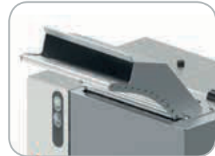
Scivolo su rulli opzionale Optional roller slide