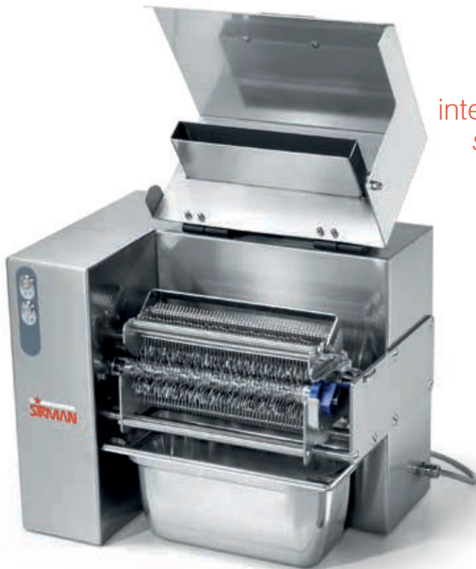
Vaschetta inox opzionale Optional s/steel tray