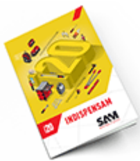
Les outils Indispensables SAM 2020