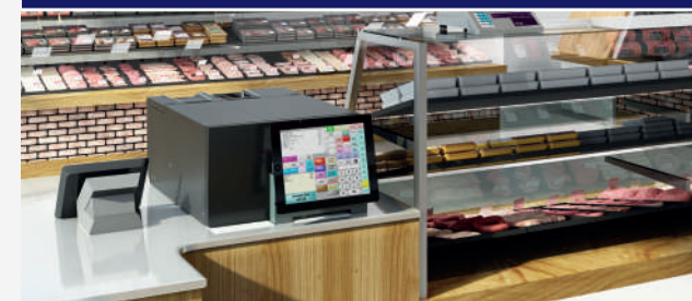
COMMERCES DE PROXIMITÉ