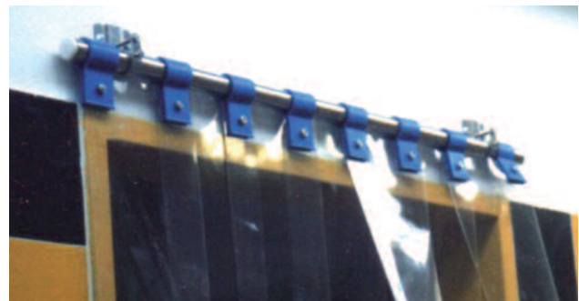
Détail du support MAVISOUPLE