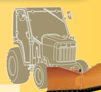
4 ANBAU HÖHENVERSTELLBAR HEIGHT ADJUSTABLE ATTACHMENT ATTELAGE REGLABLE EN HAUTEUR