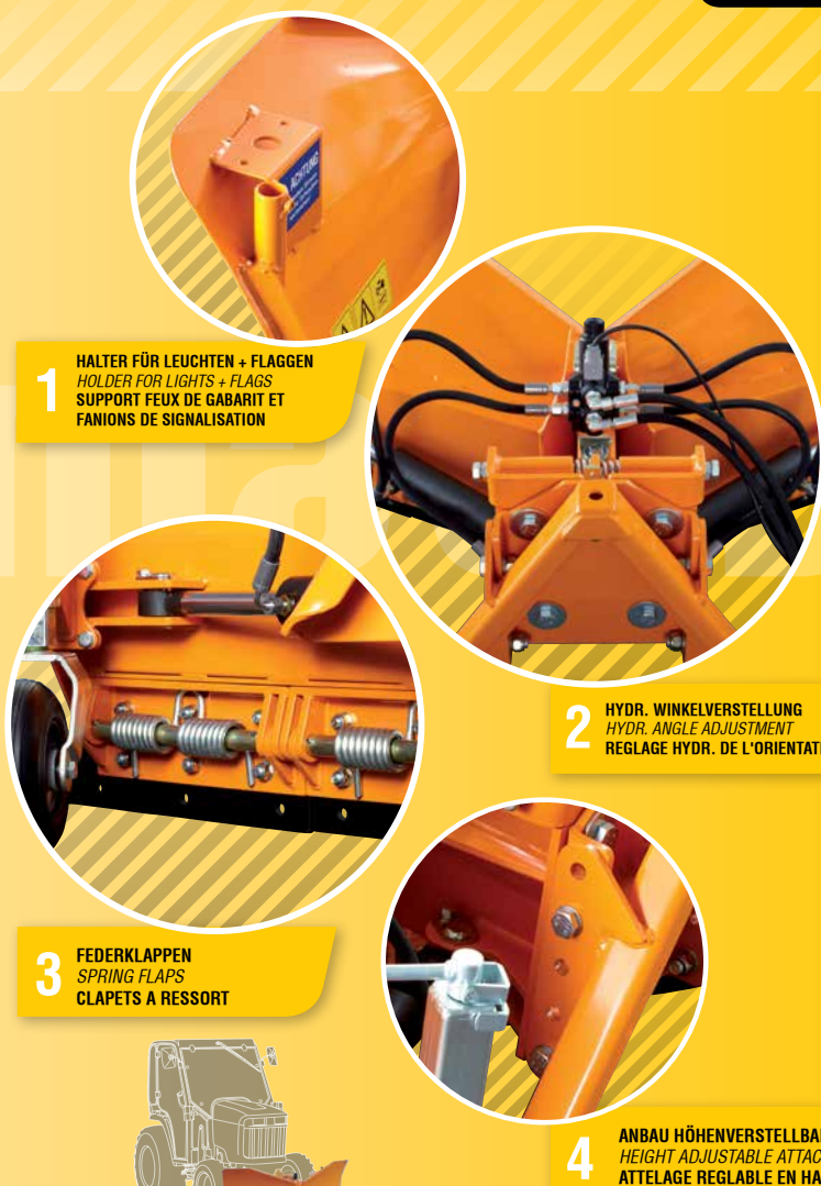
1 HALTER FÜR LEUCHTEN + FLAGGEN HOLDER FOR LIGHTS + FLAGS SUPPORT FEUX DE GABARIT ET FANIONS DE SIGNALISATION

L'emploi de bandes racleuses en hardox permet de minimiser l'usure. Les bandes racleuses font également fonction de contrebutage pour une conduite sûre près des obstacles latéraux. Des bandes racleuses en caoutchouc et en PU sont disponibles en option pour une meilleure adaptation aux conditions d'utilisation réelles.