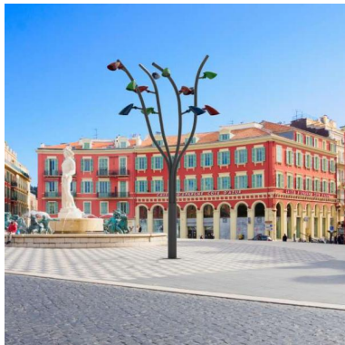
Szenen - Rendering FR - NIZZA