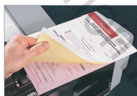
Marquage de liasses autocopiantes