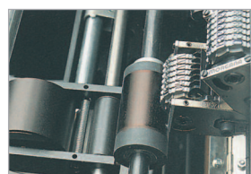
Système de numérotation rotatif