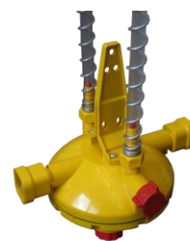
Compensateur de pente