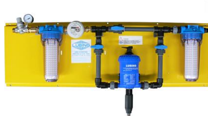
Tableau de traitement de l'eau