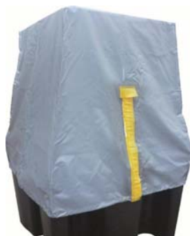
Bâche de protection Réf. BECO/BACHE