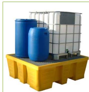
PR1500 (caillebotis PE) PRG1500 (caillebotis acier galva)