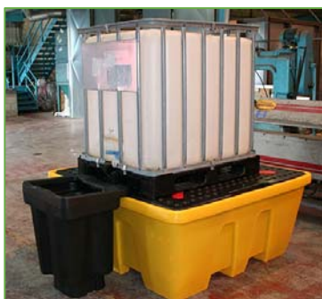
BECO1100EJ (bac jaune / caillebotis noir) Support pour soutrage en option