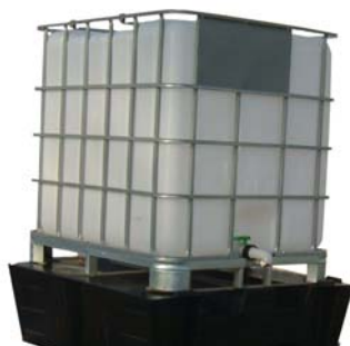
Réhausse à poser sur bac pour soutirage Réf. RHC01