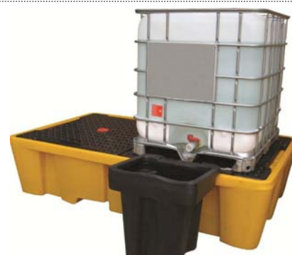
Réceptacle pour soutirage dans petit bidon