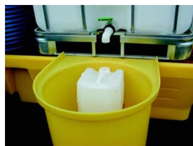
Réceptacle pour soutirage dans petit bidon