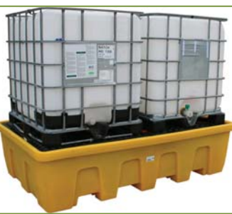
BECO1200/2C (noir) BECO1200/2CJ (bac jaune)