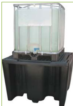
BECO1100 (noir) BECO1100J (bac jaune / caillebotis noir)