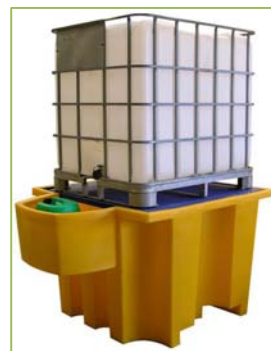
PR1100/SOUT PR1100SC/SOUT (sans caillebotis)