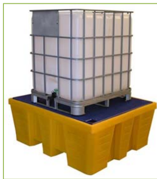
PR1000 (caillebotis PE) PRG1000 (caillebotis acier galva)