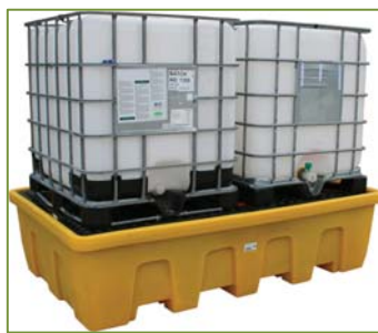
BECO1230/2C (noir) BECO1230/2CJ (bac jaune)