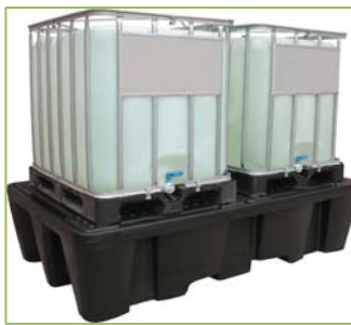
BECO1100/2C (noir) BECO1100/2CJ (bac jaune)