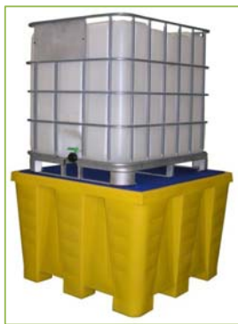
PR1200 (caillebotis PE) PRG1200 (caillebotis acier galva)