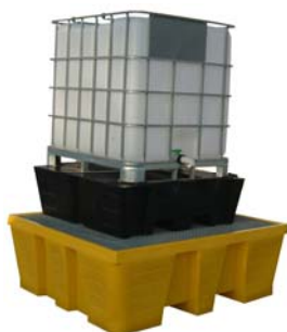
Réhausse à poser sur bac pour soutirage Réf. RHC01