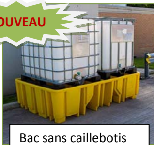
Bac sans caillebotis