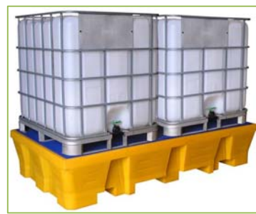
PR1050 (caillebotis PE) PRG1050 (caillebotis acier galva)