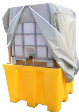
Bâche de protection Réf. PRBACHE