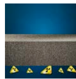
Protection contre le radon