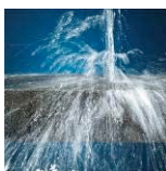
Étanche à l'eau