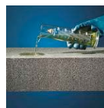
Résistant aux acides