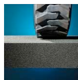
Résistant à la compression