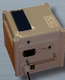
Batterie LITHIUM FER