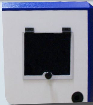
Sortie TAV L 24

La solution de protection mobile pour vos ensembles informatiques complets