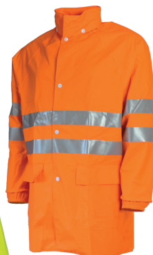
Orange Fluo 57