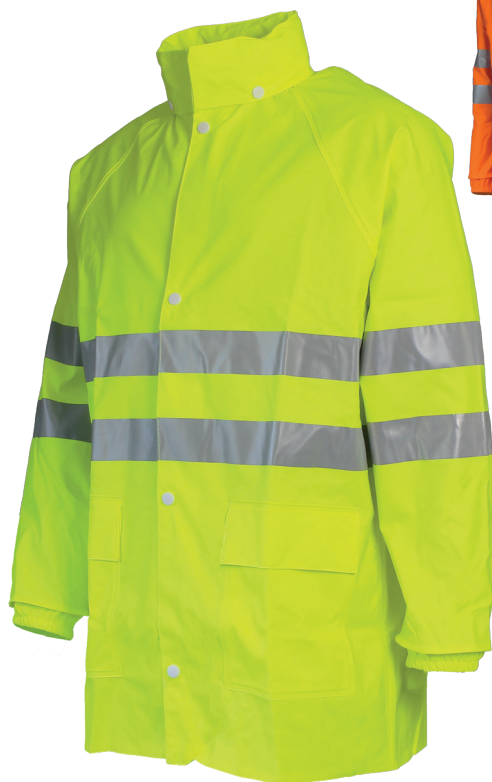
Jaune Fluo 51