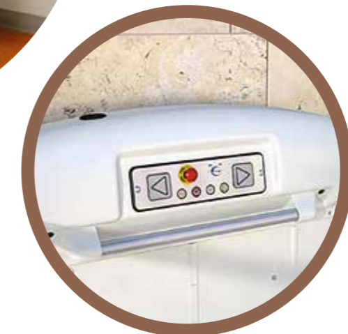
PANNEAU DE COMMANDE INTÉGRÉ