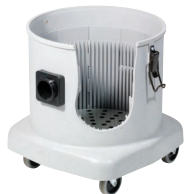
Existe en version «A» : avec prise outil à démarrage synchronisé (ponceuse, perceuse, meuleuse... max.1000W)

Aspirateurs 23L simple moteur (S) ou double moteurs (D) destinés aux applications professionnelles (BTP...), répondant aux exigences de Santé Publique inhérentes à l'aspiration de poussières colmatantes et volatiles. Puissance et vitesse d'aspiration exceptionnelles. Cuve en Structofoam garantie 3 ans. Système breveté Airflo anti-colmatage et indicateur de saturation du sac. Système NUPLUG pour un changement rapide et sans outil du câble.