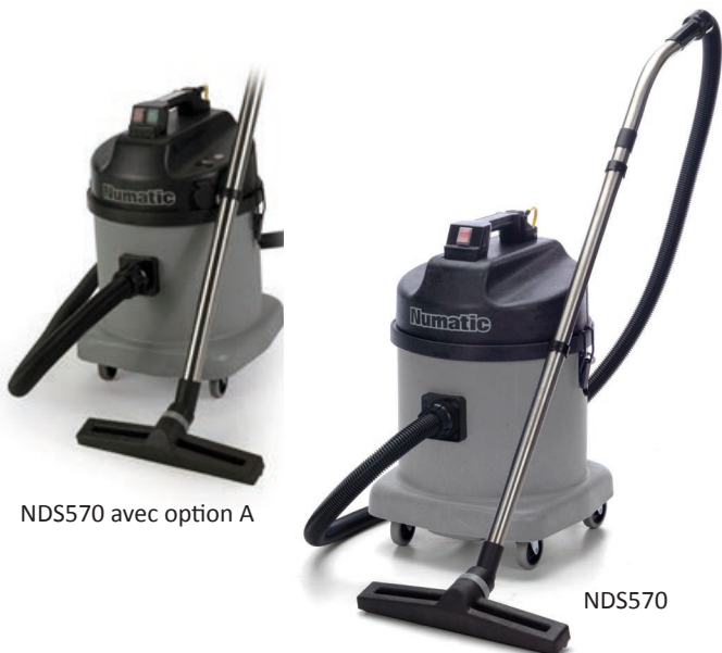
NDS570 avec option A

Aspirateurs spécial poussières fines (ciment, plâtre, quartz...)