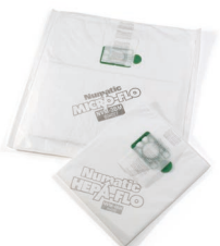
Sac MICROFLO (application toutes poussières fines) Sac HEPAFLO (application poussières standards)