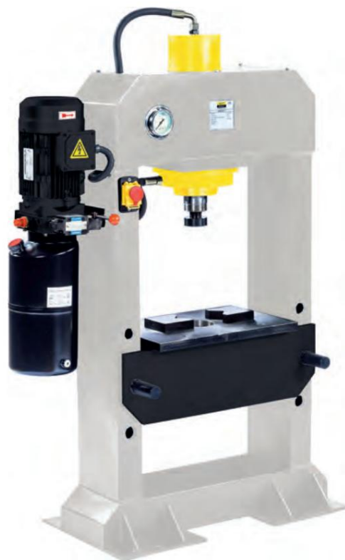
PIC: HWP E 30 T