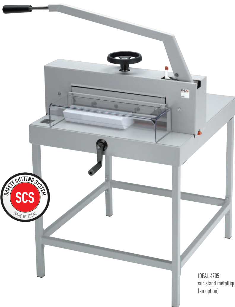
IDEAL 4705 sur stand métallique (en option)