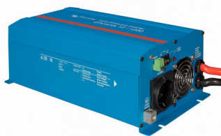
Phoenix Inverter 12/800 with Schuko socket