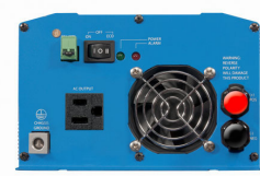
Phoenix Inverter 12/800 with Nema 5-15R socket