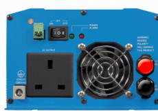
Phoenix Inverter 12/800 with BS 1363 socket