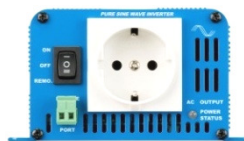
Phoenix Inverter 12/180 with Schuko socket