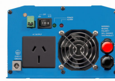
Phoenix Inverter 12/800 with AN/NZS 3112 socket