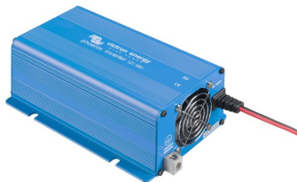
Phoenix Inverter 12/180

Veuillez consulter les photos ci-dessous.