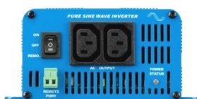
Phoenix Inverter 12/350 with IEC-320 sockets