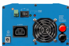
Phoenix Inverter 12/800 with IEC-320 socket