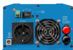
Phoenix Inverter 12/800 with Schuko socket