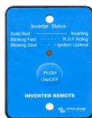
Tableau de commande à distance

Une tension batterie trop haute ou trop basse déclenche une alarme visuelle et sonore, ainsi qu'un relais pour une signalisation à distance.