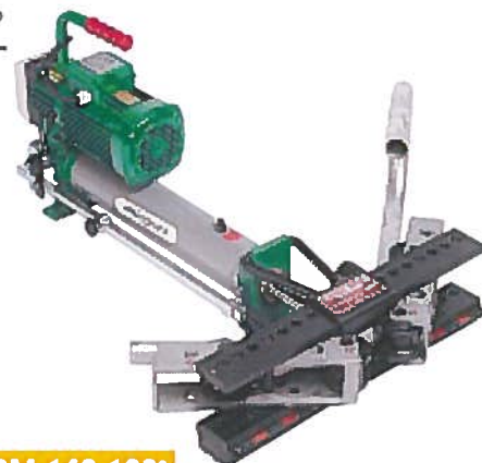
OBM 140 180°