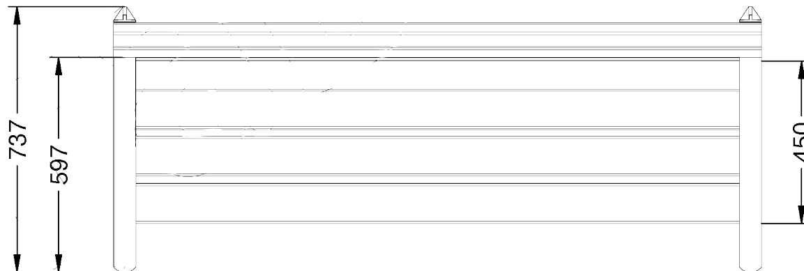
Vue du haut ▼