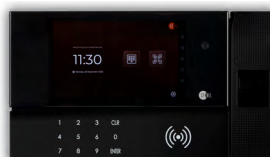
SYNERGY 5 FINGERPRINT