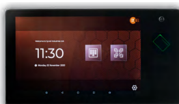
SYNERGY 10 READER