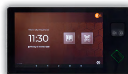
SYNERGY 10 FACE