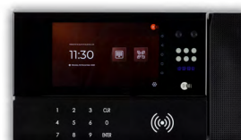
SYNERGY 5 FACE