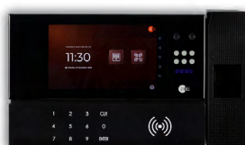
SYNERGY 5 DUAL