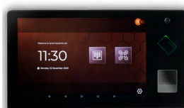
SYNERGY 10 FINGERPRINT