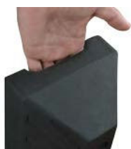
Poignée de transport