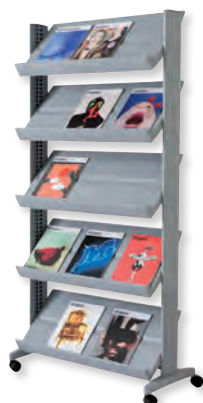
255N.35 teinte alu