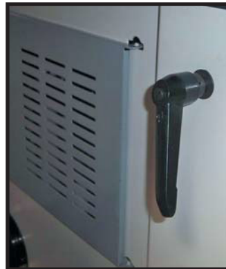
Blocage en hauteur de l'arbre de toupie Spindle shaft height adjustment locking system