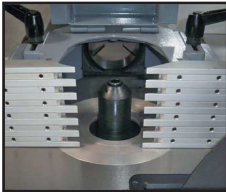
Guide de sécurité à barrettes Moulder guard's guide with small bars