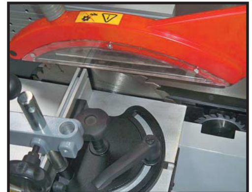
Chariot ras de lame 2000mm , lame ø 315 , inciseur ø 100mm Sliding table's guide 2000 mm , blade ø 315 mm , scoring blade ø 100 mm