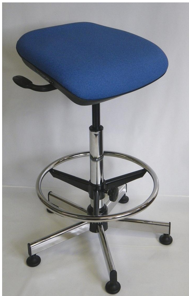
Visuel du semi assis 29AS avec repose-pieds RPTL

Composition : PVC 85% Coton/PES 15% Classement non feu : M1 / test selon normes NFP 92503 et EN1021-1-2. Résistance à l'abrasion : 150 000 cycles Martindale Tenue à la lumière : >6 Absence de phtalates / Test selon norme NF EN 15777 Efficacité contre les bactéries (MRSA) : traitement qui combine différents agents bactéricides et fongicides (certificat Sanitized)