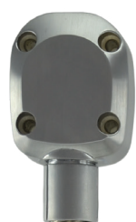
DLV40 / DLV60