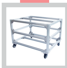
• Chassis roulant 2 niveaux

Photos et caractéristiques techniques non contractuelles. Le fabricant se réserve le droit d'effectuer toute modification sans préavis.