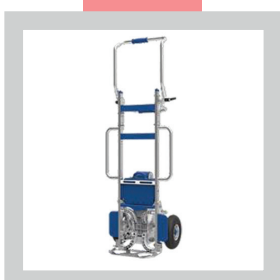
• Extensions latérales