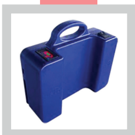
• Batterie supplémentaire