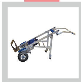
• Béquille brancard