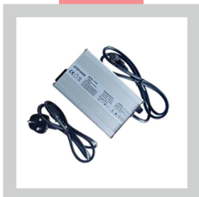
• Chargeur standard