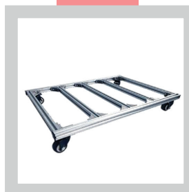
• Chassis roulant