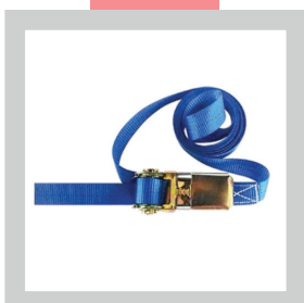
• Sangle de sécurité