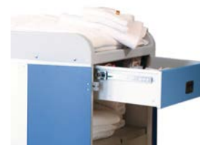
TIROIR TÉLESCOPIQUE - Façade Alu Ref: 40058 - Façade Bleue Ref: 40059