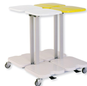
AISSY-BAG 4C (en carré)