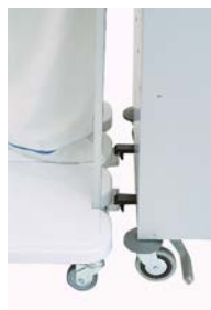
SYST. ACCROCHE - AISSY-CART/AISSY-BAG 1 Ref: 40060 - AISSY-CART/AISSY-BAG 2 Ref: 40061