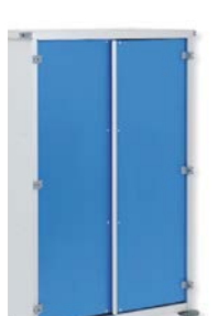
PORTES BLEUES - Pour AISSY-CART 1 Ref: 40055 - Pour AISSY-CART 2 Ref: 40056