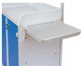
TABLETTE RABATTABLE Ref: 40063