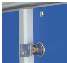
SERRURE À CLÉ