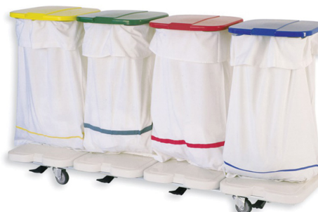
AISSY-BAG 4L (en ligne)