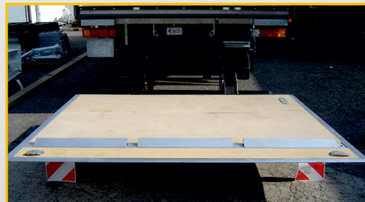
En option: Butées de roll triple et traitement de plate-forme anti-bruit.