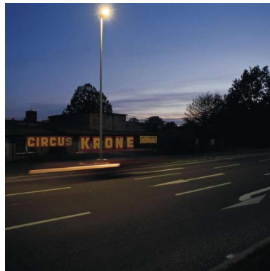
Nordring DE - Cottbus