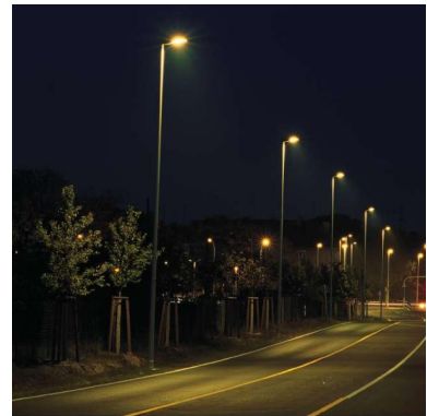
Nordring DE - Cottbus