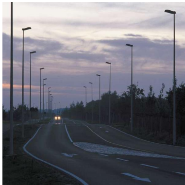
Nordring DE - Cottbus