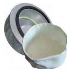
4 niveaux de filtration