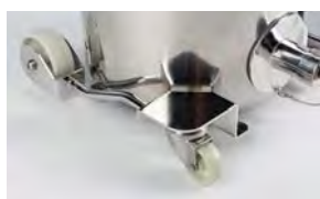
Roues industrielles protégées