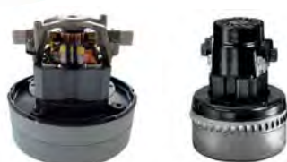
Moteur monophasé 230 V