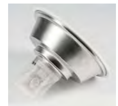
Flotteur pour l'aspiration des liquides - modèle WD