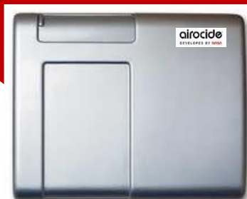
Purificateur d'air airocide®

Et selon le journal de « Institute for Laboratory Animal Research » la principale cause est l'inhalation d'allergènes et de COVs.