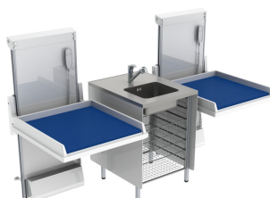
Table à langer électrique 334-082-1