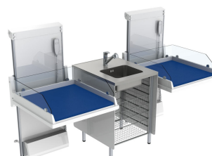
Table à langer électrique 334-083-0