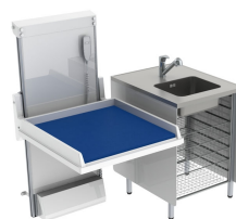
Table à langer électrique à hauteur variable 334-081-1