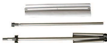
Mât télescopique de 240 cm

Le modèle en 80 cm de large est disponible également en recto/verso. (set de 2 barres supplémentaires en option).