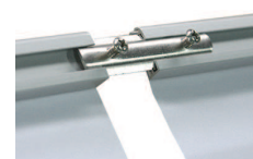
Système de jonction: Solidarisez plusieurs structures entre elles!