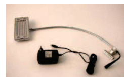
Lampe LED 78 ampoules = économies d'énergie