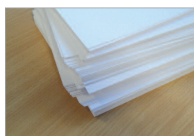
Pile de papier avant taquage