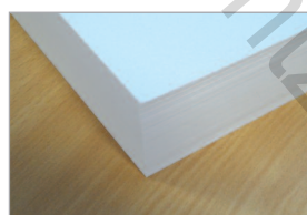
Pile de papier après taquage