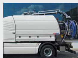
Flexible d'aspiration télescopique 360°