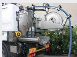
Flexible d'aspiration standard