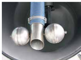
Assèchement du réservoir à boue