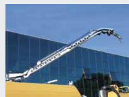
Flexible d'aspiration télescopique