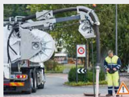
Bras combiné aspiration/rinçage