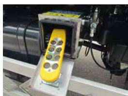
Commande de vidage