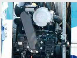
Pompes à vide à piston rotatif ou à palettes