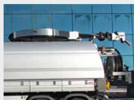
Flexible d'aspiration en spirale