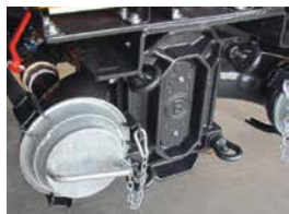
Pompe d'alimentation supplémentaire