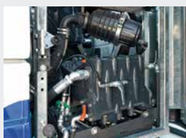
3 pompes haute pression à piston