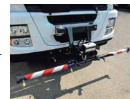
Rampe de lavage pour le nettoyage des routes