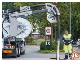
Bras combiné aspiration/rinçage