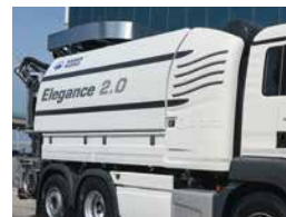
Habillage design avec réservoirs d'eau latéraux