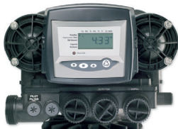
Vanne Autotrol Magnum