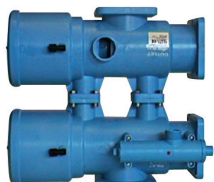
Vanne Siata 360