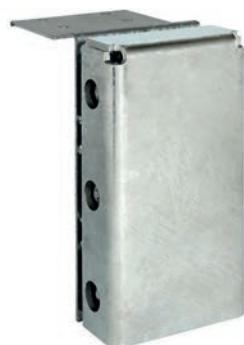
93.950.859 Butoir avec platine rallongée.