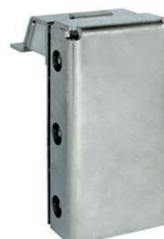
93.950.858 Butoir avec réhausse H = 100 mm.