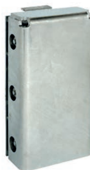
93.950.856 Butoir H = 470 mm.