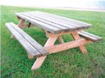
table «Plein air» classique

La gamme bois est également composée de modules d'aménagement extérieurs, tables et bancs en bois des Alpes ou certifié PEFC. Naturen assure une fabrication locale et une haute qualité de découpe et de finition.