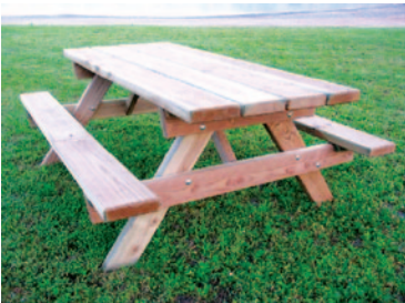
table «Plein air» Grand Modèle