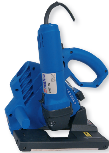
Livrée en coffret sans disques, avec clé de serrage, burin plat et notice d'utilisation.