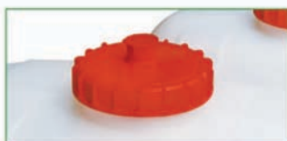
2 Finition industrielle avec bouchon