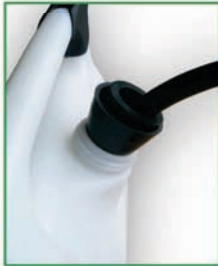
2 manchons caoutchouc livrés de série