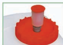
1 Finition viticole avec bonde de fermentation