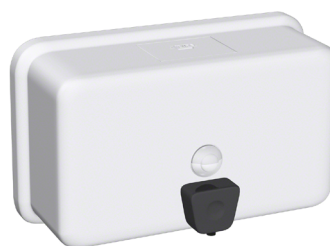
© Axeuro Industrie - www.axeuro.com En inox 304 (18/10) Laqué Blanc : AX9403W