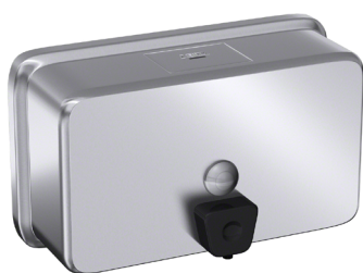
© Axeuro Industrie - www.axeuro.com En inox 304 (18/10) Brossé Poli Satiné HyperPolish : AX9403