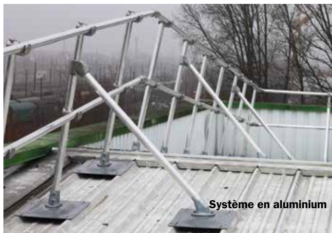
Système en aluminium